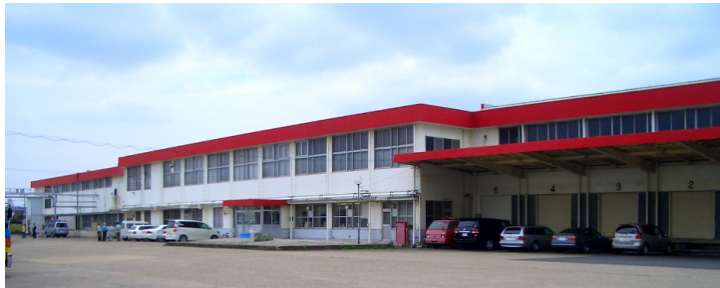
新たに立ち上げた第2商品センター

ネットオフは、「ブックオフ」の起業家支援制度によって2000年に創業いたしました。全国の顧客から宅配便により買取りをし、商品センターでシステムにより単品管理、インターネットで販売する CtoBtoC ビジネスを中古本を中心に手掛けています。無店舗型の大型リサイクルEコマースは、アメリカではほとんど例がなく、ユニークなビジネスモデルと評価されました。また、ネットオフでは4年前に事業が黒字化して以来、「トヨタ生産方式」による改善とプロセス管理のローコストオペレーションにより着実に成長を果たし、高収益体質を実現している点もアメリカの投資家の注目を集めた要因になりました。