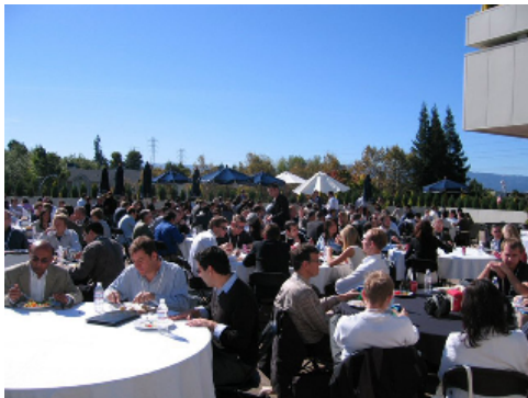
VCを中心に200~300人が参加

大会では、各社プレゼン時間を与えられ、投資家からもっとも注目を集めた企業・企業家はファイナリストに選出されます。