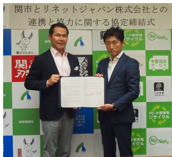
9/27 岐阜県関市との協定締結式

リネットジャパンは、宅配便を活用したパソコン・小型家電のリサイクルを通じて、限りある資源の有効活用を促進し、一層の環境・社会への貢献を目指して参ります。