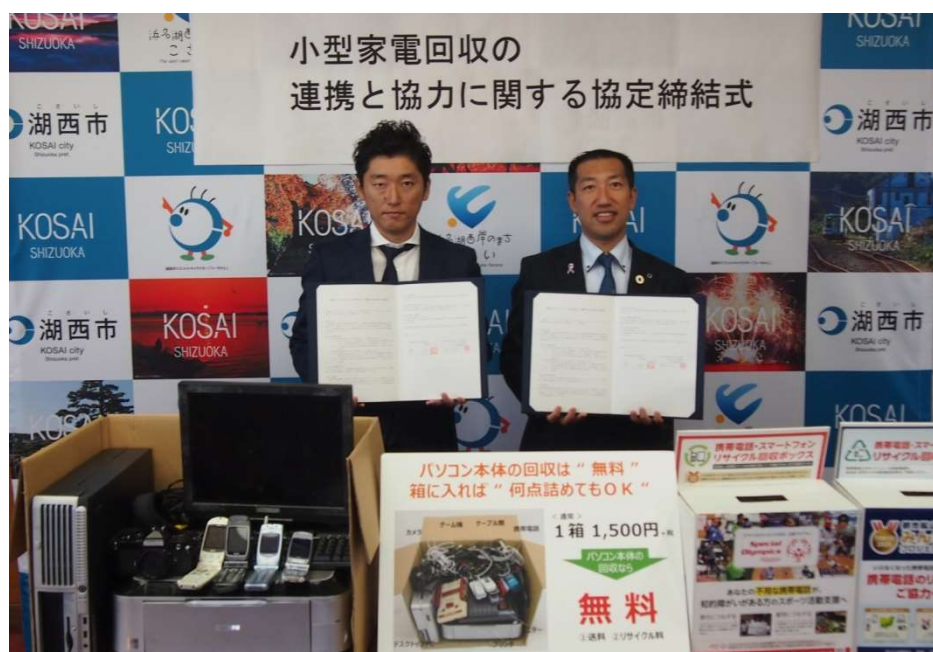
11/12 静岡県湖西市との協定締結式

11月12日に湖西市の影山市長と協定締結式を実施しました。湖西市との協定締結は全国で219例目、静岡県では7例目となります。