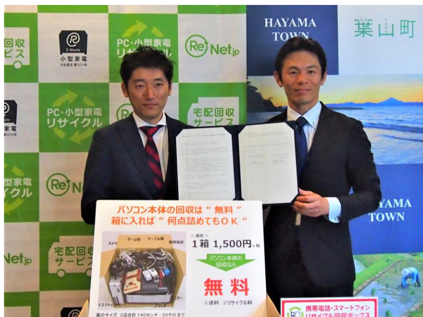
1/28 神奈川県葉山町との協定調印式

1月28日に葉山町の山梨町長と協定調印式を実施しました。葉山町との協定締結は全国で228例目、神奈川県では10例目となります。