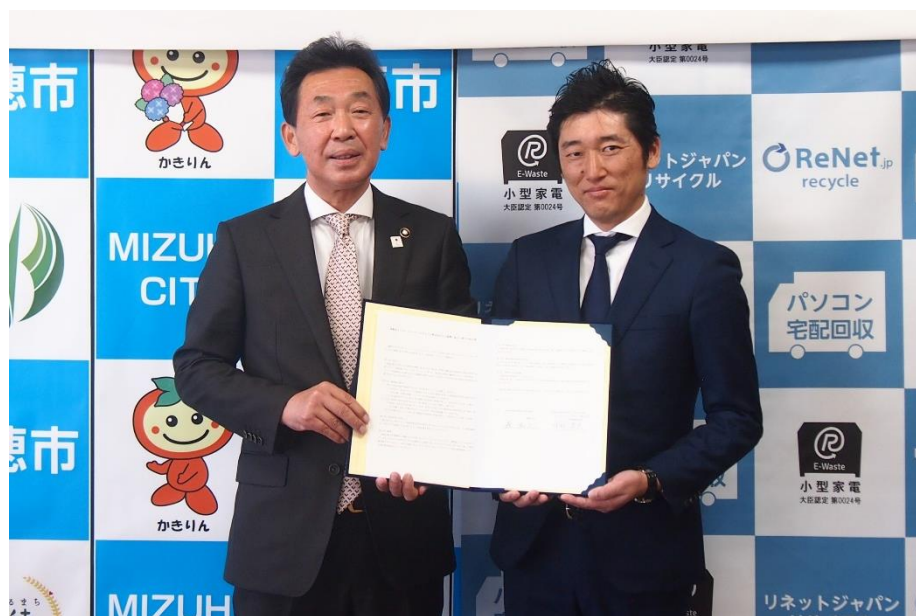
3/24 岐阜県瑞穂市との協定締結式

3月24日に瑞穂市の森市長と協定締結式を実施しました。瑞穂市との協定締結は全国で235例目、岐阜県では6例目となります。