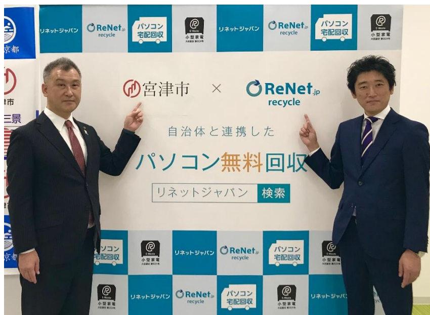
10/28 宮津市長との協定式

10月28日に宮津市長と協定式を実施しました。宮津市長との協定締結は全国で482例目、京都府内では11例目となります。